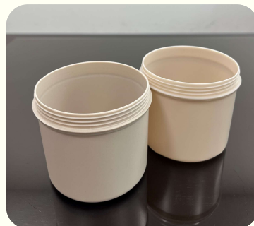
(左:牡蠣殻51% 右:牡蠣殻20%配合)